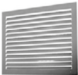
Решетка декоративная для LIGA-D (КДМ-2М)